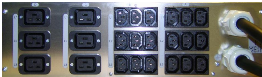
Ausführung T2B mit Betriebsnetz und Backupnetz