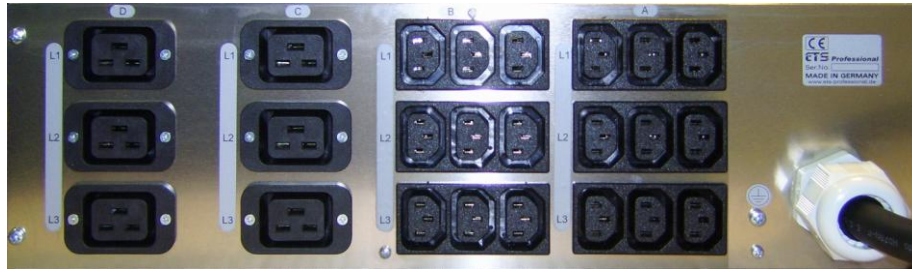
Ausführung T1B mit 20A und 10A Kaltgerätedosen