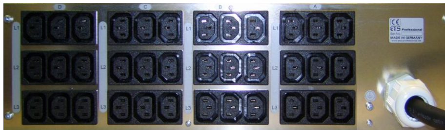
Ausführung T2A mit 10A Kaltgerätedosen